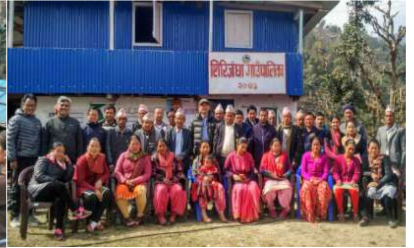
वृहत खुला छलफलमा व्यस्त निर्वाचित पदाधिकारी तथा सम्बद्ध क्षेत्रका प्रतिनिधी सहभागीहरु वृहत ३ दिने कृषि तथा पर्यटन समापन कार्यक्रममा उपस्थित सम्पूर्ण सहभागीहरु