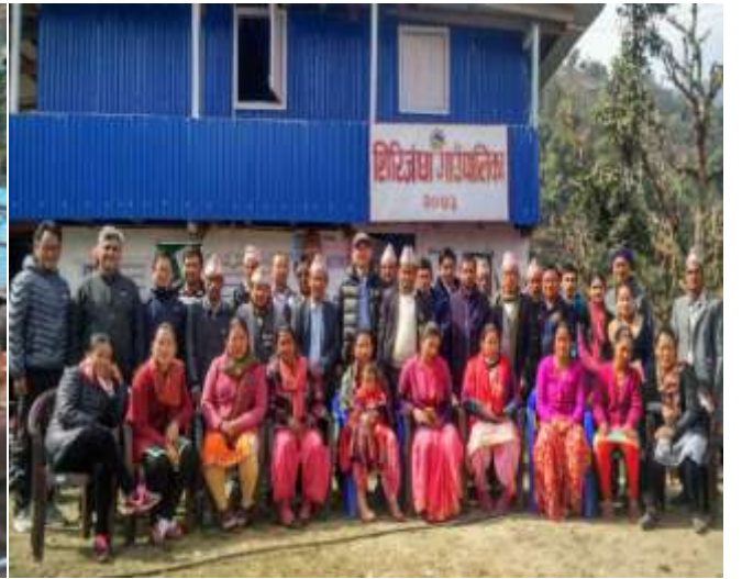
वृहत खुला छलफलमा व्यस्त निर्वाचित पदाधिकारी तथा सम्बद्ध क्षेत्रका प्रतिनिधी सहभागीहरु